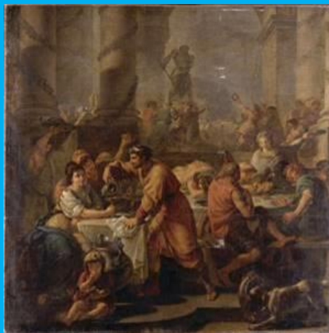
Tableau d'Antoine-François Callet représentant des Romains réunis pendant les grandes fêtes des Saturnales.

Pour les Romains, mais aussi d'autres cultures, craignaient à cette période sombre de l'année que le Soleil meure et ne revienne jamais, laissant derrière lui ténèbres et désolation.